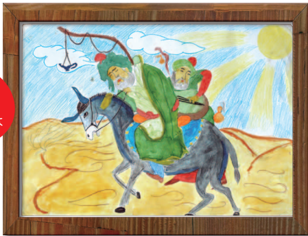
ウズベキスタン 「シルクロードへの道」 ベグソットくん(13歳)

スリランカの子どもたちは黄色い太陽を描くけど、日本で育った私の息子(スリランカ人)は赤く描くのよ!