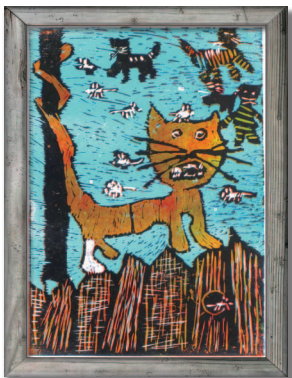
ポーランド「ねこ」 ポールくん(9歳)