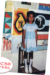
こどものころの イラストレーターさん

実は私、子どものころ「カナガワビエンナーレ国際児童画展」に応募したのよ。私の絵が日本に届けられると思うと夢のようだったわ。あれから30年。スリランカ人の夫と4歳の息子と3人で厚木市に暮らしやすくなり、カナガワビエンナーレと運命的に再会したの。信じられないくらいうれしかったわ。