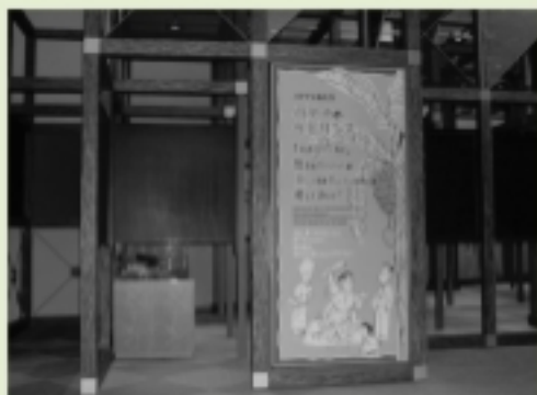
バナナのラビリンス入口

バナナのラビリンスは、クイズを解きながら迷路(ラビリンス)を歩き、バナナから見える様々な問題について考える展示です。