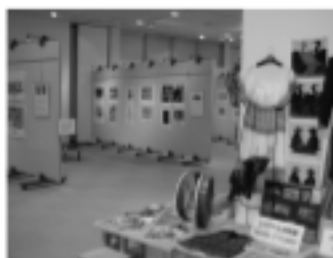
写真:2002FIFAワールドカップTM記念文化催事 カナガワビエンナーレ国際児童画展特別展

展示室A(180㎡)と展示室B(110㎡)があり、あわせて広さ(290㎡)で利用することもできます。付属する展示パネルや覗きケースも利用できますので、絵画、写真、工芸品などの発表会で利用してみませんか。また、会議室としても利用いただけます。