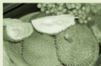
果物の王様だよ。でも乗り物に持ち込むのは禁止なんだ。