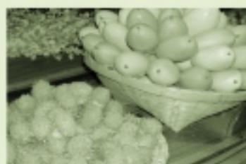
海の生き物みたいだね。