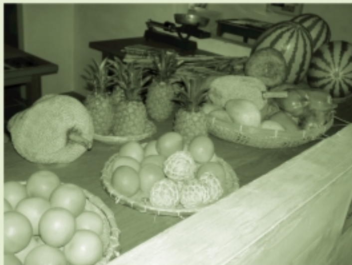
ある国の海辺のお店だよ。どこだと思う?