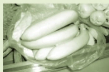
おなじみの果物だね。でもいろいろ調べてみると…