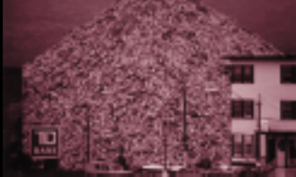
製紙工場から出た木屑 [1983年 カナダ/オンタリオ州]

A 答えは、紙を作っている工場から出た木のくずです。これは、写真集「百年の愚行」の中の写真です。