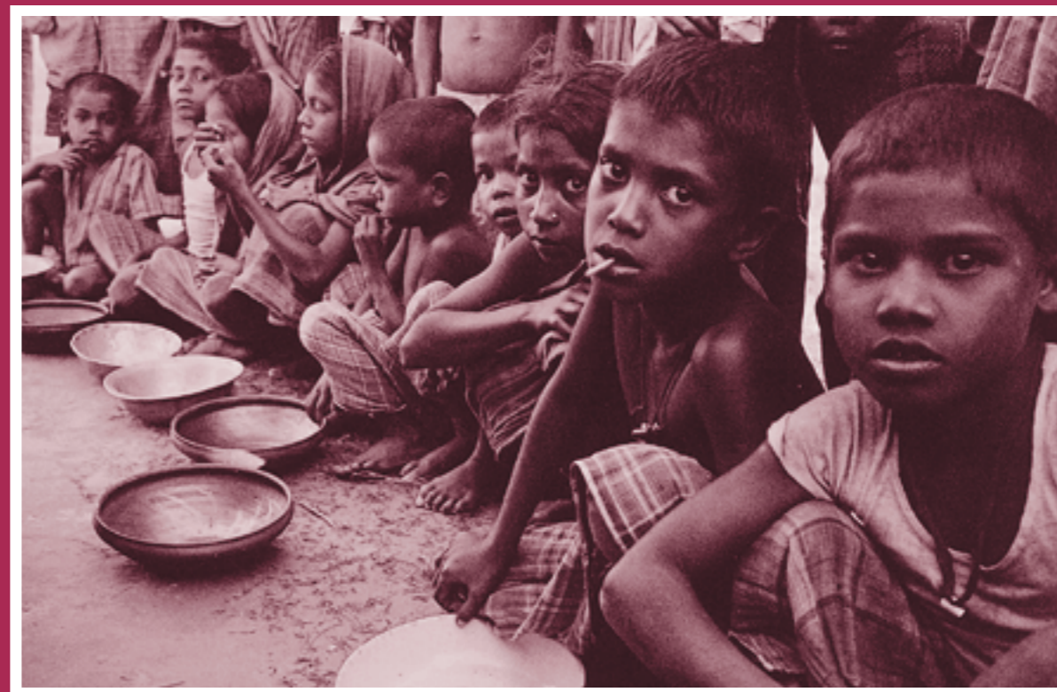
政府の配給を待つ