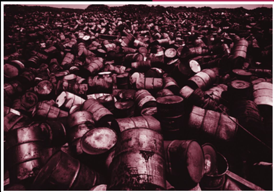
[1970年代~1990年頃 英国領アセンション島]