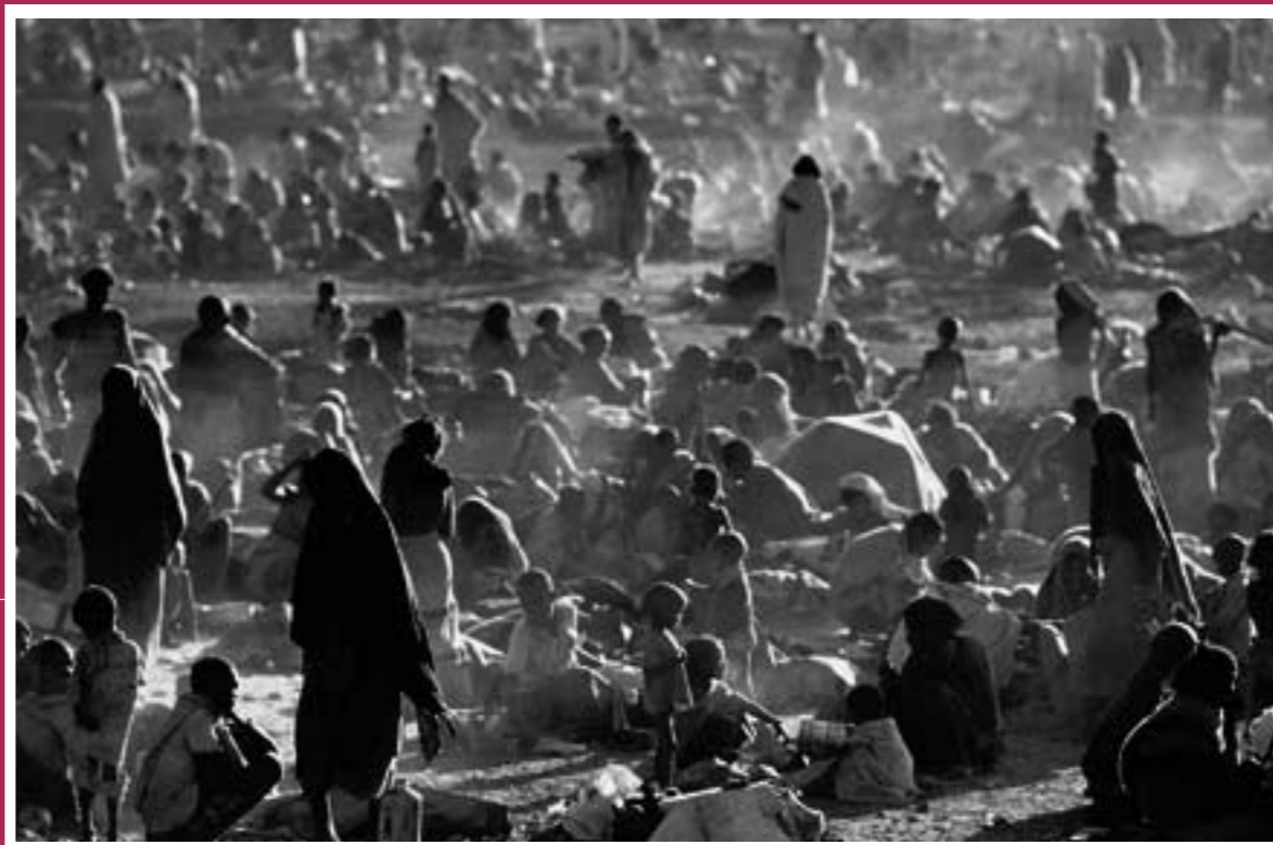
内戦と飢餓に苦しめられている