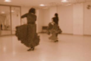
フラメンコ練習風景

演劇や音楽などの芸術的な創作活動を行える場として、また多様な芸術表現活動を展開できるフリースペースとしてご利用いただける多目的スタジオです。(120㎡)