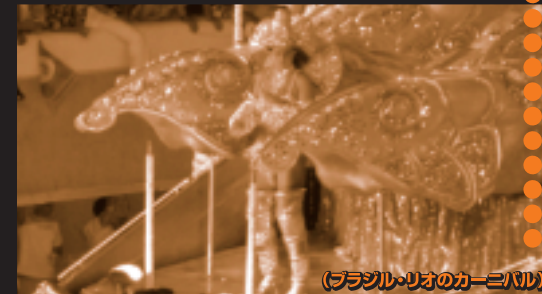
(ブラジル・リオのカーニバル)

愛情(あいじょう)や熱情(ねつじょう)といったブラジル人のたましいを表現した、ブラジルで一番大きなお祭りです。1年間かけて、さまざまな衣装や、りっぱな山車(だし)を用意します。3日間続くお祭りでは、リズムカルな音楽やサンバにあわせて通りを行進します。