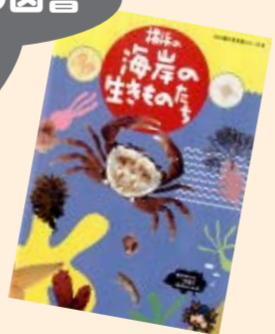
『横浜の海岸の生きものたち 川と海の生き物シリーズ6』 横浜市環境保全局水質地盤課

横浜の海や海岸には、魚、カニ、貝、イソギンチャク、海藻などたくさんの生きものたちが暮らしています。海に行ったら、この本に載っている生きものに会えるかもしれませんよ？